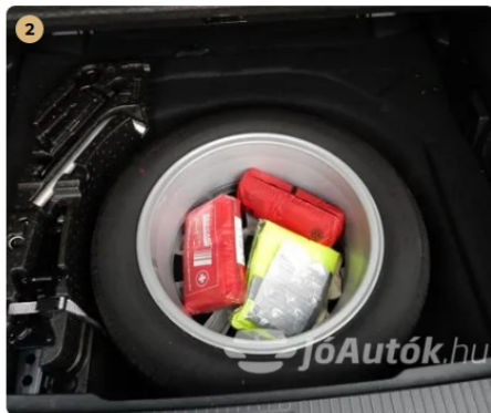
✓ Teljes értékű pótkerék