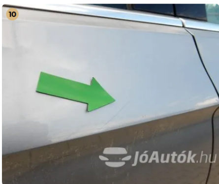
⚠ Karc a jobb hátsó ajtón