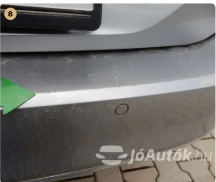
⚠ Karcolások a hátsó lökhárító rakodóperemén