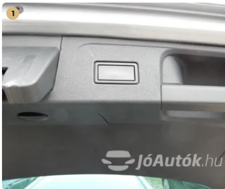
✓ Elektromos csomagterajtó