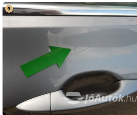
⚠ Karc a jobb hátsó ajtón