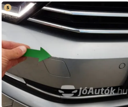
⚠ Horzsolás az első lökhárítón