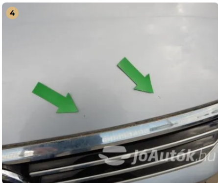
⚠ Kavicsnyomok az első motorháztetőn