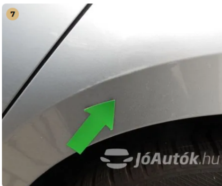
⚠ Horzsolás a bal hátsó sárvédőn