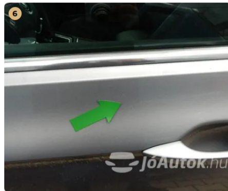
⚠ Karc a bal első ajtón