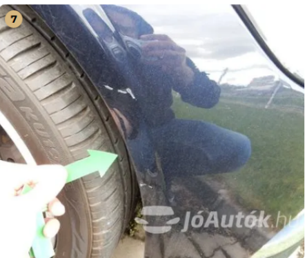
⚠ Apró sérülések az első lökhárító jobb oldalán