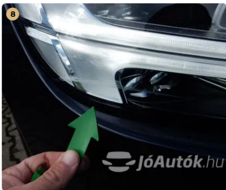
⚠ Első fényszórón horzsolás Polírozással eltüntethető