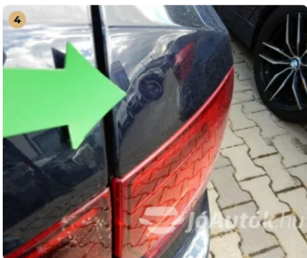
⚠ Apró horpadás a jobb hátsó sárvédőn