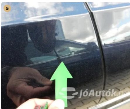
⚠ Kisebb karcok az autó jobb oldalán