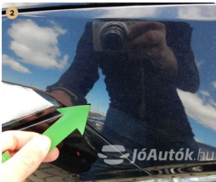
⚠ Karc a jobb első sárvédőn