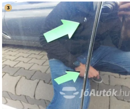
⚠ Apró karc és peremkopás a bal első ajtón