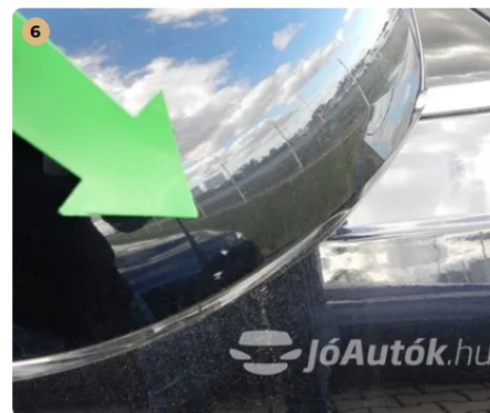
⚠ Apró sérülés a jobb oldali tükrön