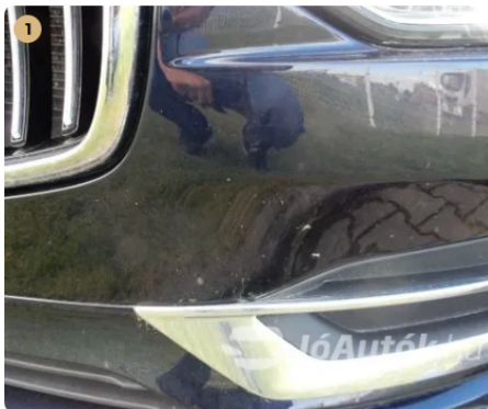
⚠ Kavicsnyomok az első lökhárítón