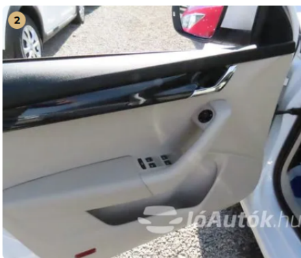
Szép kopásmentes belsőtér