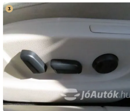
elektromos első ülések