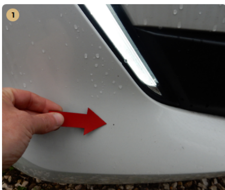
⚠ első lökhárító