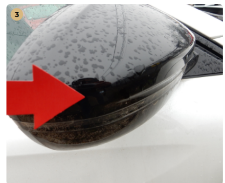
⚠ jobb első ajtó