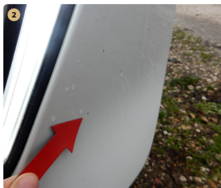
⚠ első lökhárító